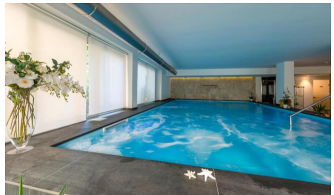
CENTRO BENESSERE: PISCINA IDROMASSAGGIO E CASCATA, BAGNO TURCO, SAUNA, DOCCIA EMOZIONALE POSSIBILITA' DI MASSAGGI.