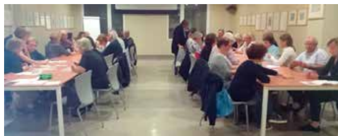
A sinistra le coppie vincitrici del torneo di burraco di fine corso Sopra i partecipanti alle lezioni di burraco proposte dai Soci A.I.P.A. - Lecco - E.T.S.