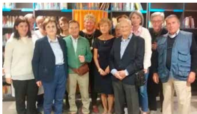
Alcuni dei partecipanti alla festa per il pensionamento