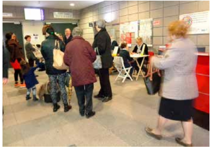
Alcuni cittadini in attesa

I dati rilevati hanno interessato 455 persone: di questi, quattro donne e altrettanti uomini hanno visto confermata la Fibrillazione Atriale a loro nota e per la quale sono già in terapia, mentre sono stati individuati ulteriori tre uomini e una donna con ritmo cardiaco anomalo; a due di loro sono stati riscontrati anche valori pressori elevati, pertanto è stato loro consigliato di rivolgersi al pronto soccorso. Su loro richiesta, sono stati accompagnati dai volontari. Agli altri è stato consigliato di consultare il proprio medico di famiglia. AIPA ringrazia la direzione dell'Ospedale Manzoni di Lecco per la possibilità di poter contribuire ancora una volta alla prevenzione della salute dei cittadini. Visti i risultati ottenuti nel corso di questi anni e conside-