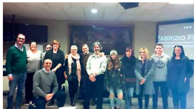
Alunni e insegnante del corso di novembre/dicembre 2018

e venerdì dalle ore 9 alle 11, o rivolgendosi ai volontari AIPA presso la Hall dell'Ospedale S. Leopoldo Mandic di Merate martedì e giovedì dalle ore 10 alle 12 o direttamente al fotografo al 3923166297 - fabriziofoto.it@gmail.com - www.fabriziofoto.it