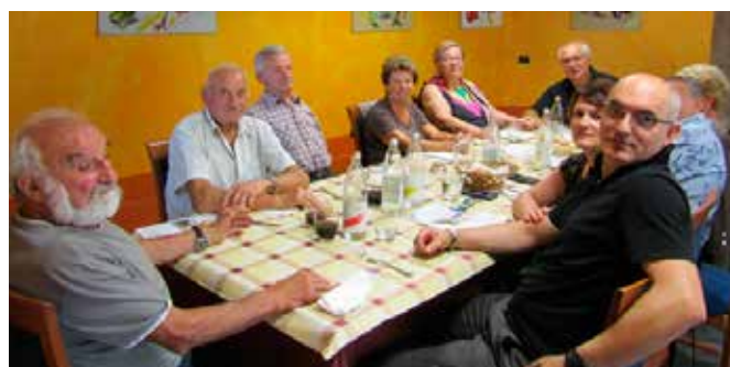
Alcune immagini dei commensali