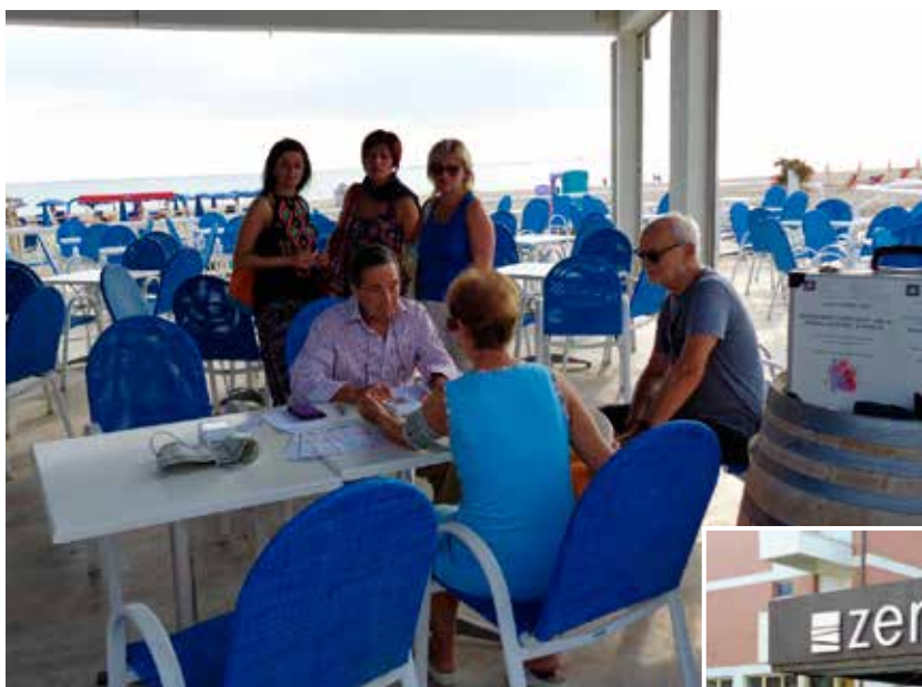
Lo screening anche nel bar della spiaggia.

Durante il viaggio di ritorno a Lecco, abbiamo fatto una tappa a Loreto, per ammirare la stupenda Basilica, la venerata Madonna Nera e la Santa Casa; non è mancata l'ammirazione per tutta la zona sacra che, come sempre, desta emozioni.