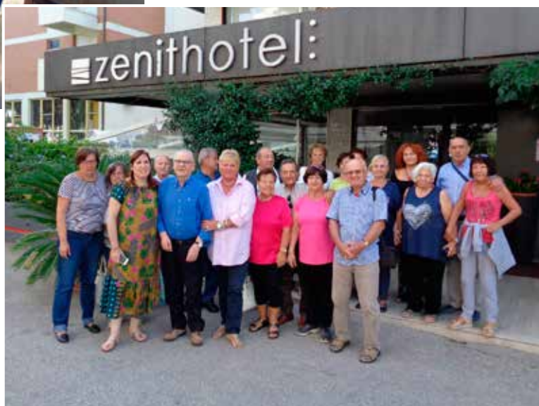
Foto di gruppo dei partecipanti alla vacanza a Giulianova.