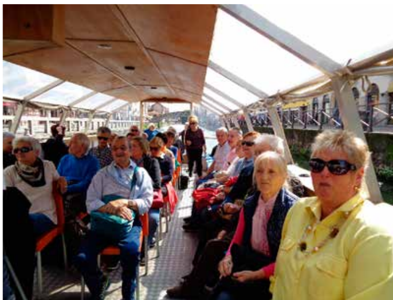
I soci A.I.P.A. Lecco-ONLUS in due momenti della navigazione.

Il villaggio è stato riconosciuto patrimonio dell'Umanità dall'UNESCO nel 1995.